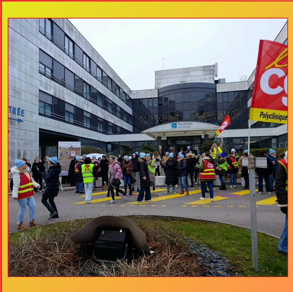
Débrayage à la polyclinique de Picardie